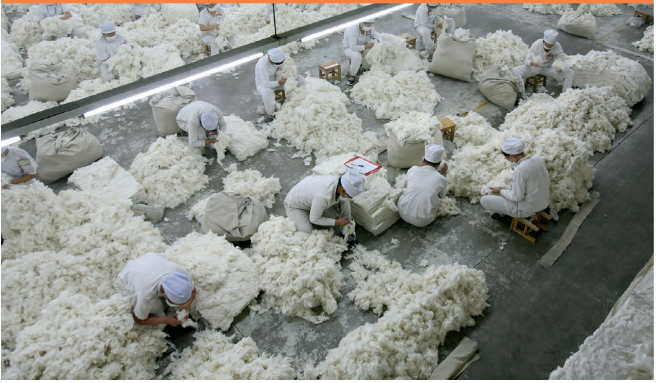
Fotoğraf: Çin haberlerinde yayımlanan bir görsel

Bu uygulamalar, Çin'in taraf olduğu veya üzerinde bağlayıcı etkisi bulunan birçok uluslararası anlaşma ve sözleşmeyle açıkça çelişmektedir. Çin, Uluslararası Çalışma Örgütü (ILO) üyesi olmasına rağmen, örgütün 29 No'lu Zorla Çalıştırma Sözleşmesi'ni (1930) ve 105 No'lu Zorla Çalıştırmanın Ortadan Kaldırılması Sözleşmesi'ni (1957) 2022 yılına kadar onaylamamış, ancak uluslararası baskılar sonucunda onayladığını duyurmuştur. Ancak sahada yapılan araştırmalar ve belgeler, Çin'in sözleşmelerin ruhuna ve yükümlülüklerine aykırı davrandığını göstermektedir. Ayrıca Çin, ILO'nun 87 No'lu Sendika Özgürlüğü ve Örgütlenme Hakkı Sözleşmesi ile 98 No'lu Örgütlenme ve Toplu Pazarlık Sözleşmesi'ne taraf değildir, dolayısıyla işçilerin haklarını koruma noktasında temel güvenceleri sağlamamaktadır.