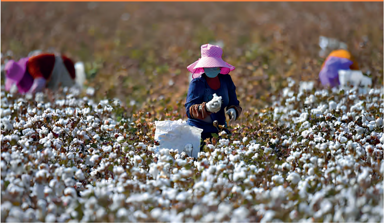
Fotoğraf: Doğu Türkistan'da işçiler pamuk topluyor.

sektörlerini hedef alan bu çağırının, Çin'in Doğu Türkistan bölgesindeki sistematik zorla çalıştırma politikalarına karşı küresel farkındalık oluşturmayı amaçladığı görülmektedir. İnsan hakları örgütleri, uluslararası markaların tedarik zincirlerini gözden geçirmesi ve zorla çalıştırma içeren üretim süreçlerine son vermesi gerektiğinin altını çizdi. 120 Bu fabrikalarda üretilen ürünlerin, dünya genelinde tüketicilere ulaşması, sorunun yalnızca bölgesel değil küresel bir mesele olduğunu gözler önüne sermektedir. Bu girişim, uluslararası toplumun Çin'in Doğu Türkistan bölgesindeki insan hakları ihlallerine karşı pozitif bir gösterge olarak değerlendirilebilir. Ancak, bu çağırının hedef aldığı markaların bu talepleri ne ölçüde yerine getireceği belirsizliğini korumaktadır.