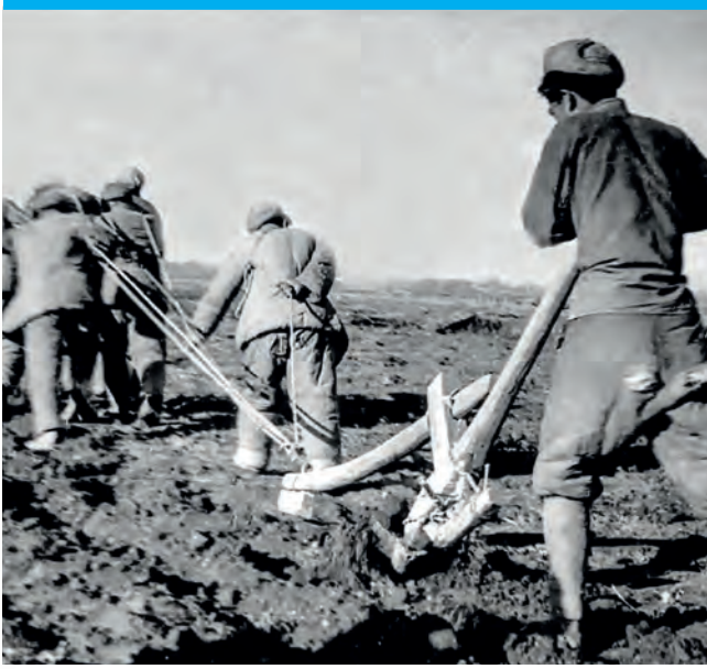
Fotoğraf: Üretim ve İnşaat Kolordusu çorak arazileri geri canlandırmak için çalışıyor.