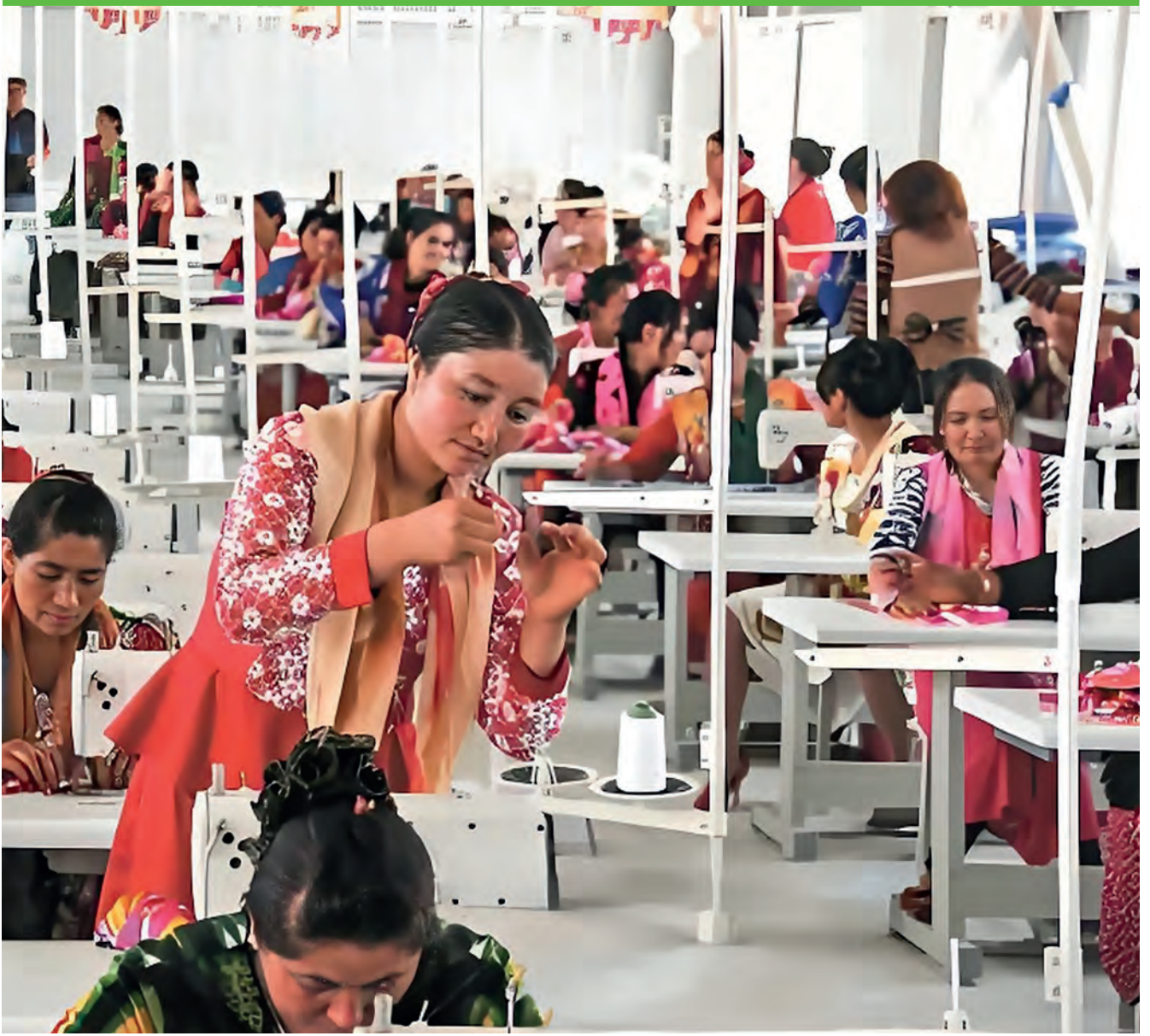
Fotoğraf: Doğu Türkistan'da çalışan tekstil işçileri.

çalıştırmayla üretilen ürünlere yaptırımlar uygularken, birçok ülke modern kölelikle mücadele amacıyla ulusal yasalar geliştirmiştir. Şirketlerin tedarik zincirlerini denetlemesi ve şeffaflık sağlaması ise, zorla çalıştırmayı önleme çabalarının önemli bir parçası haline gelmiştir.